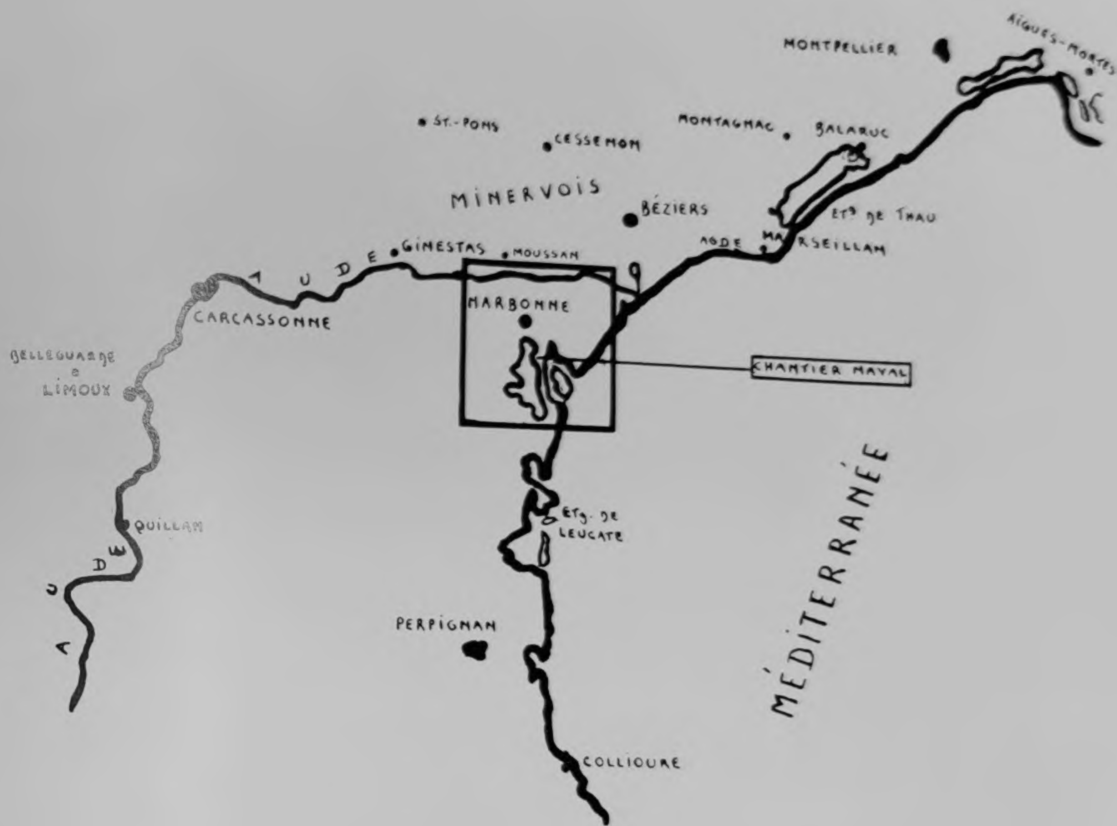
Bassin de l'Aude.