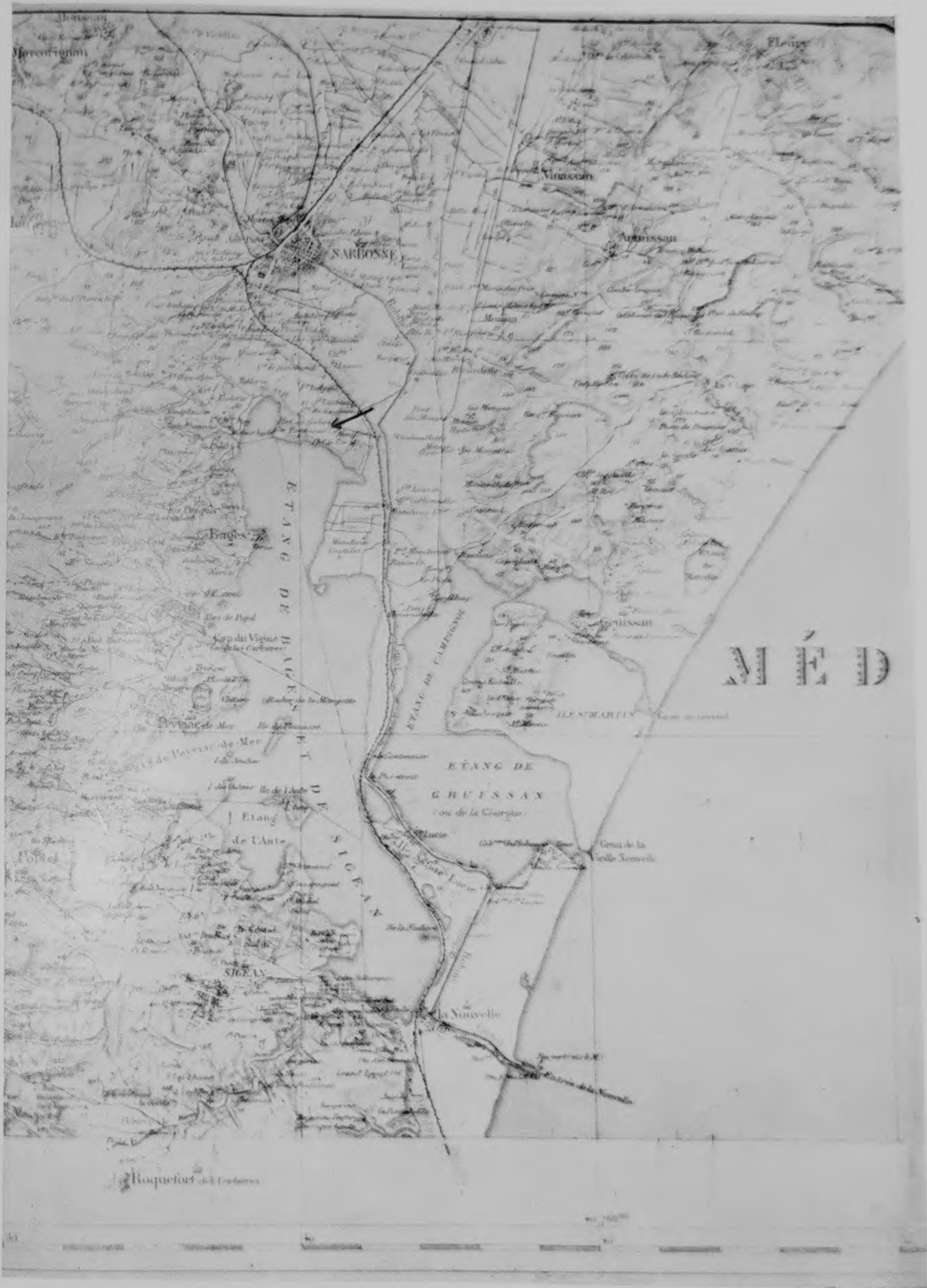
Carte au 1 : 100.000 e .