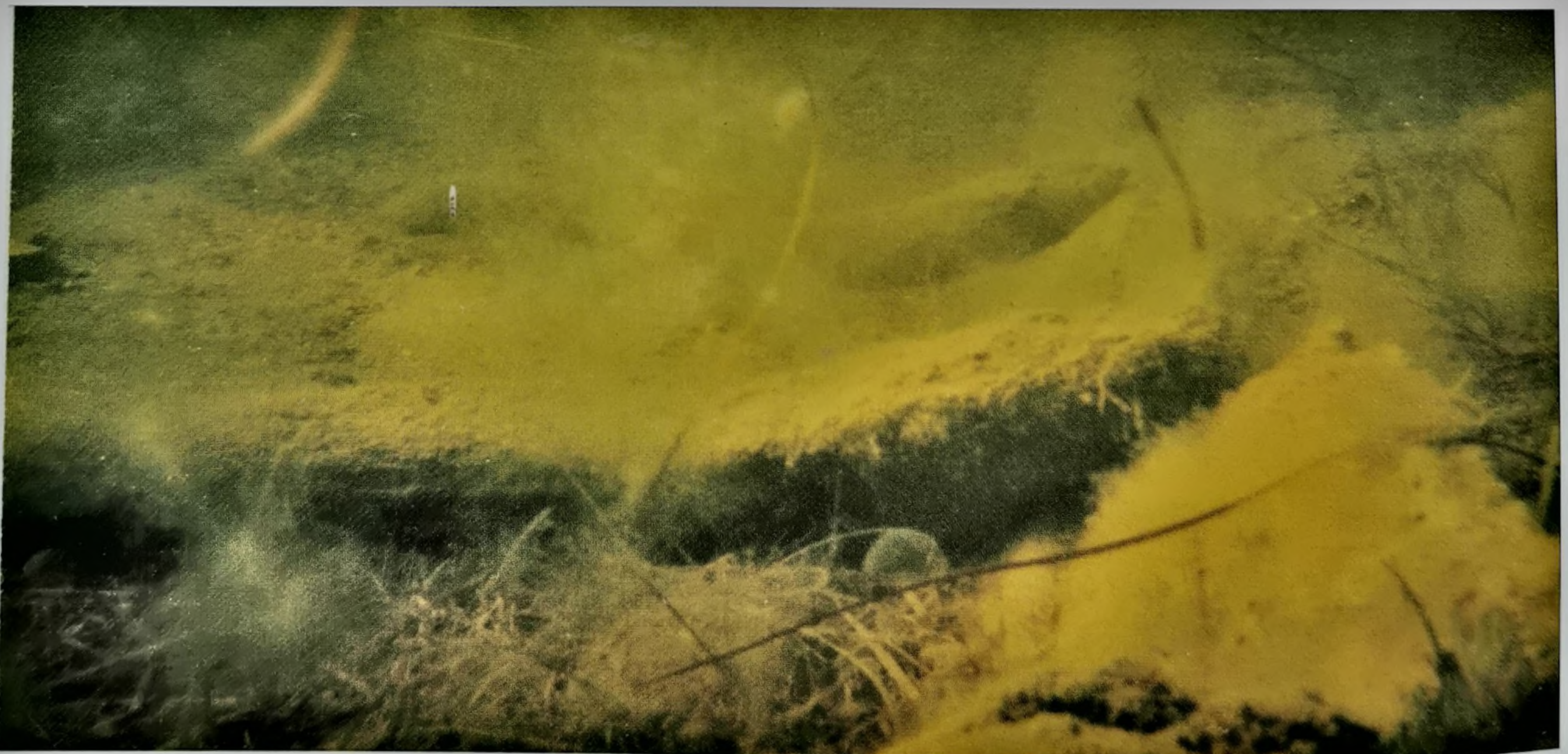
Plancher et membrures.

Pour certains, la fouille était empreinte du souvenir de cette bataille et des navires sarrasins coulés quelque part dans les étangs.