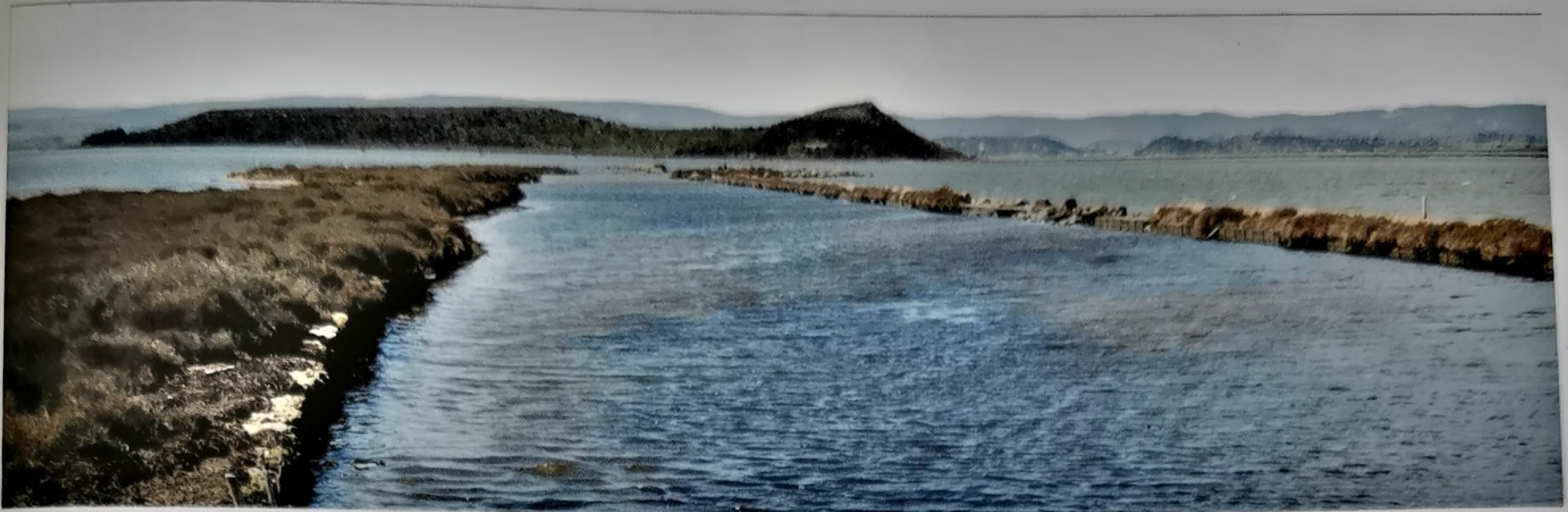
Estuaire du « Canal des Romains » face à l'île de l'Aute.