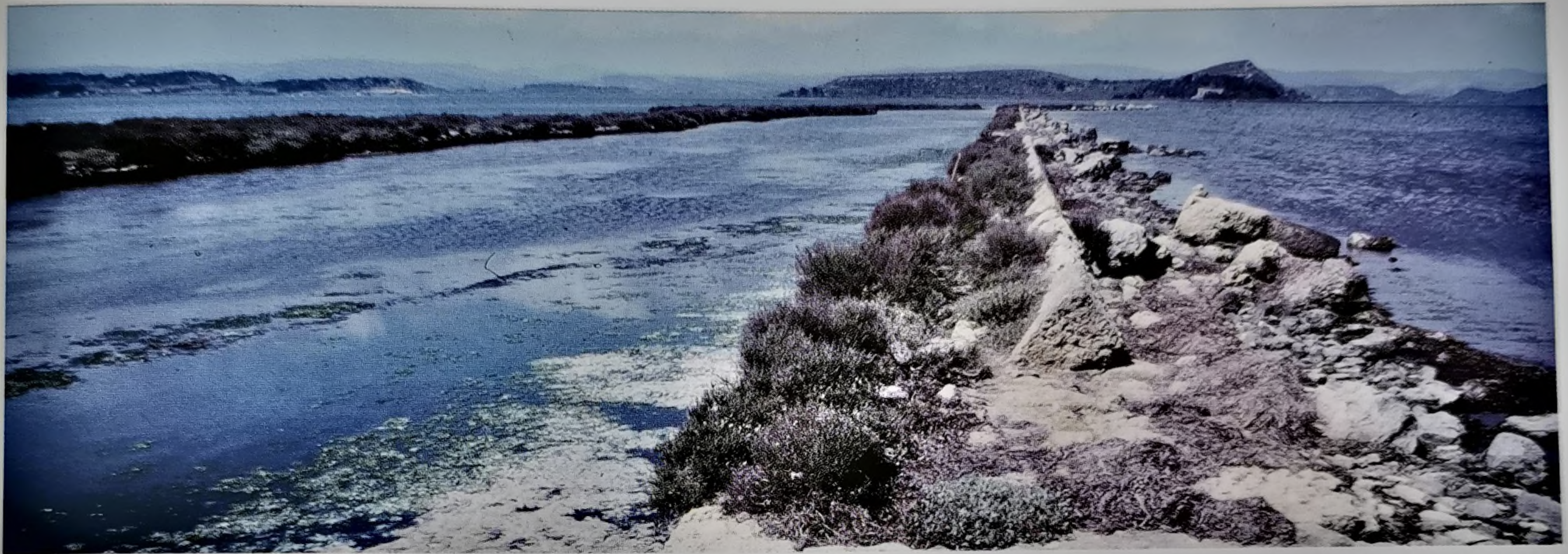
Architecture émergée de la rive droite.